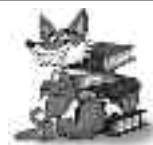
Der Wettenberger Lesehund

Bücherei der Evang. Kirchengemeinde Krofdorf-Gleiberg montags von 15:30 Uhr bis 18:30 Uhr